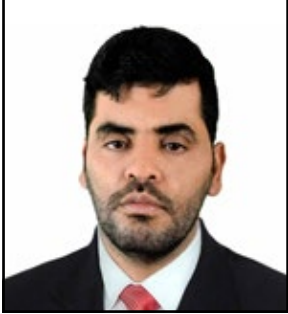
كتابات / احمد القفيلي

تشكل الكوارث الطبيعية مثل الأمطار الغزيرة والسيول تهديداً كبيراً لمخيمات النزوح، حيث تزداد الصعوبات والمعاناة للمقيمين في هذه المخيمات التي غالباً ما تكون غير مجهزة لمواجهة الظروف الجوية القاسية في ظل هذا الواقع، تصبح إدارة الطوارئ أمراً حيويًا لحماية الأرواح وتقليل الأضرار.. سنستعرض في هذا المقال أهم التحديات التي تواجه المخيمات أثناء هذه الكوارث، بالإضافة إلى بعض الحلول والمقترحات للتعامل معها.