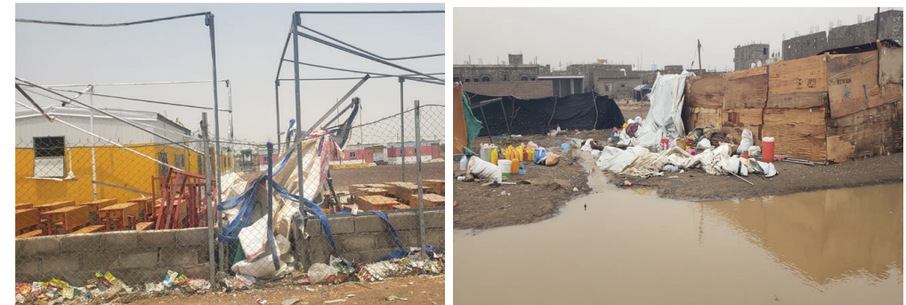
جانب من الأضرار في المدارس (الشبيكات الحديد) وتدمير للمأوى والمواد الغير غذائية