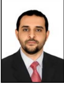
كتابات / اسماعيل السعيدى

مع اقتراب العام الدراسي الجديد 2024-2025، تبرز أهمية إحقاق الأطفال النازحين بالتعليم كأولوية ملحة لتحقيق مستقبل أفضل لهم وللمجتمعات التي يعيشون فيها فالأطفال النازحون، هم أكثر الفئات حاجة للدعم التعليمي لضمان حقوقهم الأساسية في التعليم والنمو.