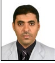
كتابات / محمد يحيى السعيد

التعاون الاجتماعي هو جزء أساسي من النسيج البشري، ويساهم بشكل كبير في تحسين جودة الحياة للأفراد والمجتمعات حيث إن هذا التعاون يصبح أكثر أهمية في أوساط النازحين، الذين يواجهون تحديات كبيرة تتعلق بالتكيف مع بيئات جديدة والحصول على الموارد الأساسية.