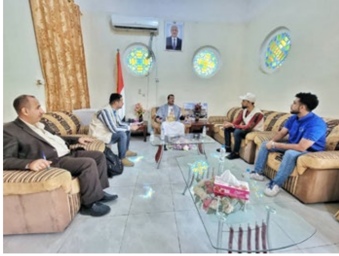
التحديات التي تواجهها السلطة المحلية ومكاتبها

وأشاد بالتسهيلات التي تقدمها السلطة المحلية للمنظمة لتسهيل عملها وتذليل كافة الصعوبات أمامها أثناء تنفيذ مشاريعها خلال الفترة الماضية..