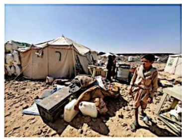
وفي عام ٢٠٢١، تعرّضت مأرب لعدد من الهجمات وبحسب تقديرات الوحدة العنيفة التي سقط إثرها شخص داخل محافظة مأرب.