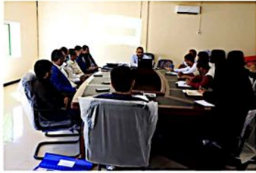
حيث يوجد فيها أكبر مخيم على مستوى الجمهورية مخيم الجفينة والذي يقطن فيها (٧١١٥٤) فرد نازح.

مناقشة استمارة أداة تقييم المواقع لتنسيق الاحتياجات الأساسية في مخيمات النزوح