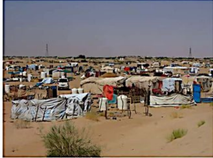
والتي تبغيب المنظمات الإنسانية إلا ما ندر.

النازحون في المخيمات الجديدة، ومن ضمنهم والد عمار، استكروا عدم قيام المنظمات الإنسانية بدورها المنشود في توفير مدرسة مؤقتة، ويقول والد عمار إن كثيراً من الحزن يتصره وهو يرى طفله الذي كان أكثر أفرانه تفوقاً في مدرسته قبل