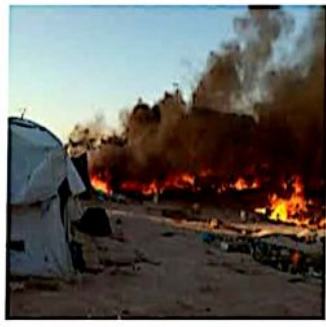
حريق منزل أسرة نازحة بمخيم الجفينة

دعا المرصد الأورومتوسطي لحقوق الإنسان إلى تعزيز جهود الإغاثة للنازحين في مأرب، وذلك بعد أيام من احتراق منزل لأسرة نازحة أدى إلى وفاة وإصابة كامل أفراد الأسرة. وقال المرصد في تغريدة حسابه على تويتر "بينما كان الأطفال حول العالم يحتفلون بالعام الجديد، فقد ٣ أطفال يمينيين حياتهم وأصيب ٣ آخرون بحروق متفاوتة نتيجة حريق شب في مكان إيواءهم بمخيم الجفينة للنازحين جنوبي مأرب". وأضاف "هذا الحادث المؤسف جزء من واقع مأساوي يعيشه النازحون في المخيمات هناك وينبئ إلى ضرورة تعزيز جهود الإغاثة". وأعلنت الوحدة التنفيذية لإدارة مخيمات النازحين في مأرب، مقتل ثلاثة أطفال وإصابة ٣ آخرين بجوار والدتهم ووالدهم بحروق بالغة جراء حريق شب في منزلهم بمخيم الجفينة أكبر مخيمات النزوح في مأرب، في ظروف صعبة يعيشها النازحون جراء التصعيد الحوئي في المحافظة.