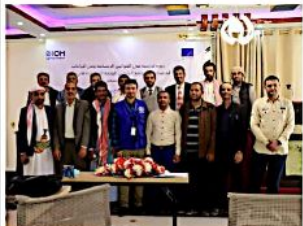
عمل ونقاشات حول المبادئ الخاصة بالعمل في إدارة وتنسيق المخيمات واكتساب المشاركين القدرة على التدريب وتقديم المواد التدريبية الخاصة بإدارة وتنسيق المخيمات للآخرين وإيضاً اكتسابهم المعرفة والثقافة بمختلف القوانين الإنسانية ومبادئ وتحليل مخاطر الحماية في المواقع وبالإضافة إلى تطبيق البيات وحل وتخفيف النزاعات المجتمعية في المواقع الخاصة بالنازحين.

عقدت المنظمة الدولية للهجرة (IOM) ثلاث دورات تدريبية لبعض منسقي المواقع التابعين للوحدة التنفيذية بمحافظة مأرب. وتمحور الثلاث التدريبات حول دورة تدريبية في إدارة وتنسيق المخيمات ودورة تدريب المدربين ToT في إدارة وتنسيق المخيمات التدريب وإخيراً دورة تدريبية في القوانين الدولية وحل وتخفيف النزاعات الذي استمر لمدة ١٩ يوم ١٦ مشارك مولوه من الاتحاد الأوروبي. وتخلل التدريب حلقات عمل مكثفة وتكاليف وأوراق عمل ونقاشات حول المبادئ الخاصة بالعمل في إدارة وتنسيق المخيمات واكتساب المشاركين القدرة على التدريب وتقديم المواد التدريبية الخاصة بإدارة وتنسيق المخيمات للآخرين وإيضاً اكتسابهم المعرفة والثقافة بمختلف القوانين الإنسانية ومبادئ وتحليل مخاطر الحماية في المواقع وبالإضافة إلى تطبيق البيات وحل وتخفيف النزاعات المجتمعية في المواقع الخاصة بالنازحين.